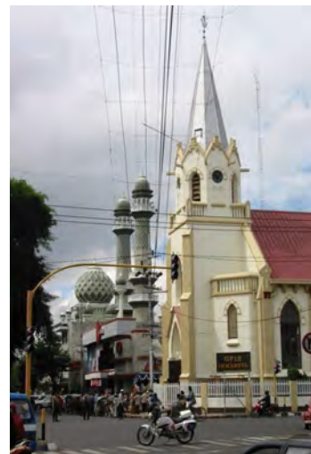
Malang, GPIB Immanuel, foto 2009.