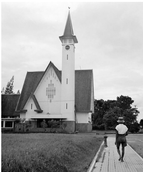
Jakarta (Batavia), Nassaukerk, jaren 1930