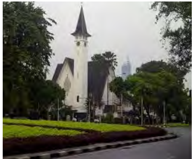
Jakarta, GPIB Paulus, jaren 1980