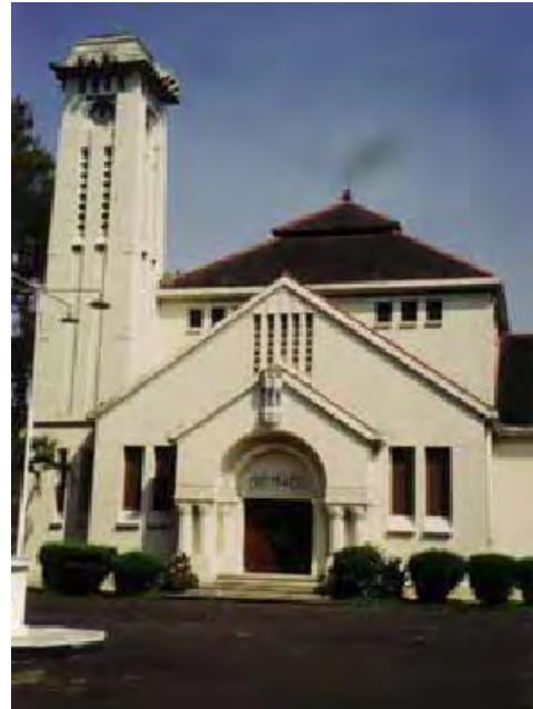
Bandung, GPIB Bethel, gebouwd 1925, foto 2000