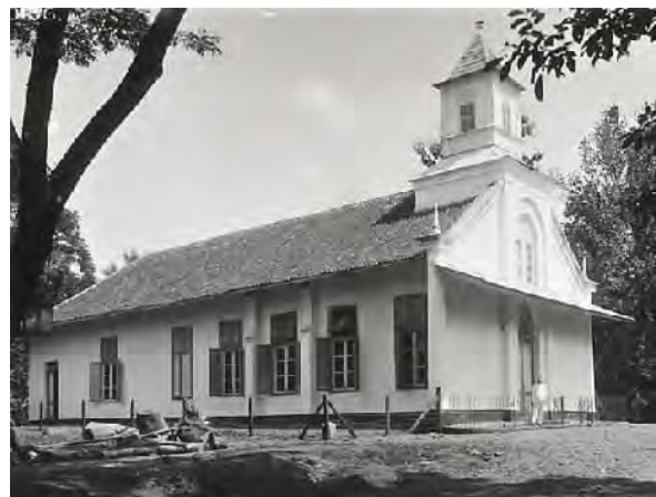
Depok, Indische Kerk 1930