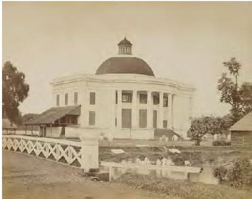
Jakarta (Batavia), Willemskerk, ca 1860