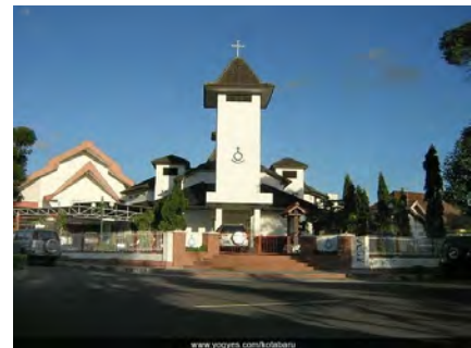
Yogyakarta, HKBP, voormalige GK (foto 2008)