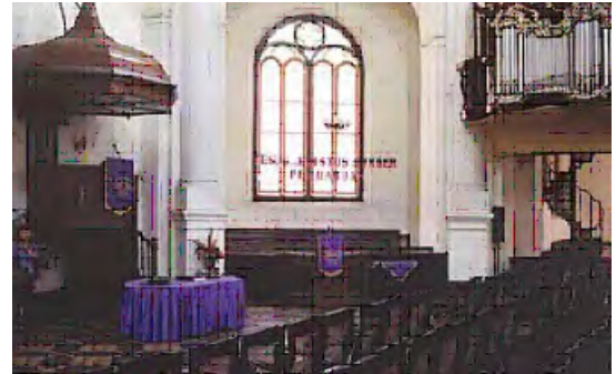
Semarang, GPIB-Immanuel, Koepelkerk (Gereja Blenduk), gebouwd 1753, interieur, foto 2004.