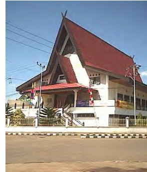
Banjarmasin: GPIB Maranatha