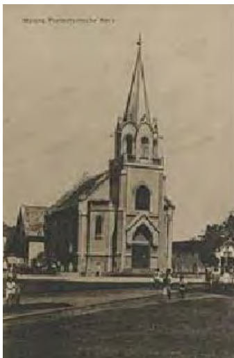
Malang, Indische Kerk, gebouwd omstreeks 1900; foto 1915, Collectie KITLV.