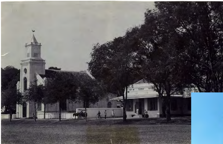
Makassar (Celebes), Indische Kerk 1925