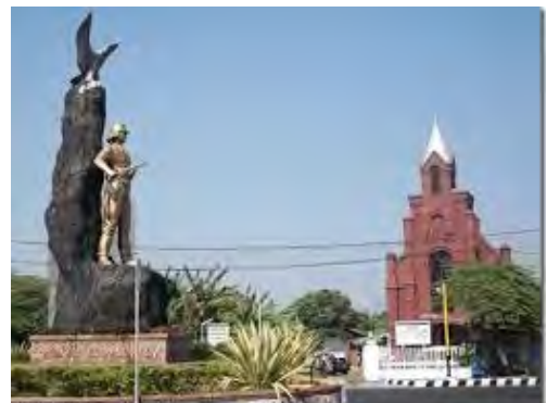
Kediri, GPIB Immanuel