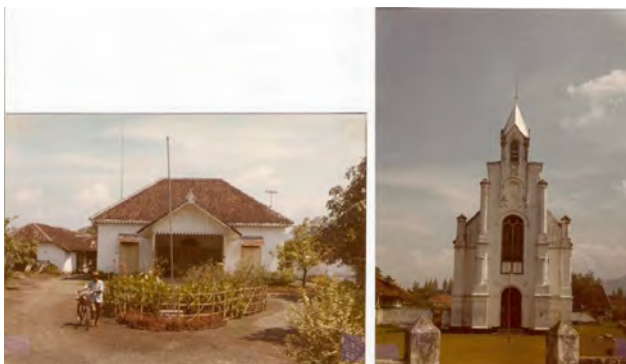
Kediri, pastorie en kerk, voor de oorlog