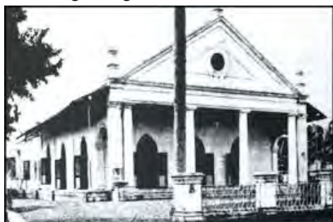
Jakarta, Gereformeerde Kwitangkerk, voor 1924