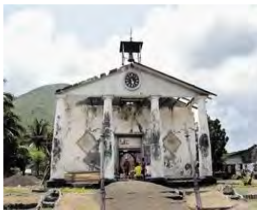
Bandaneira, kerk daags na de verwoesting in 1999