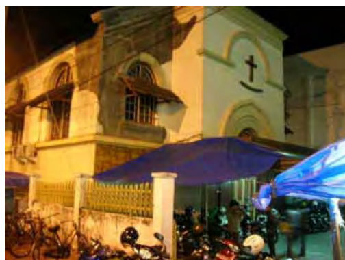
Yogyakarta, GPIB Marga Mulya, 2012