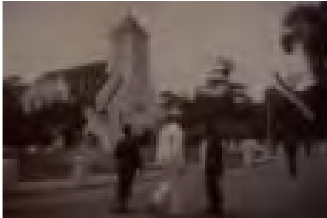
Buitenzorg, Indische Kerk, 1926