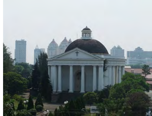
Jakarta, GPIB Immanuel, ca 2000