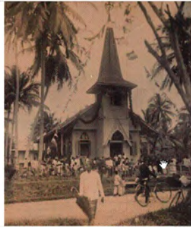
Banjarmasin: Indische Kerk, 1912