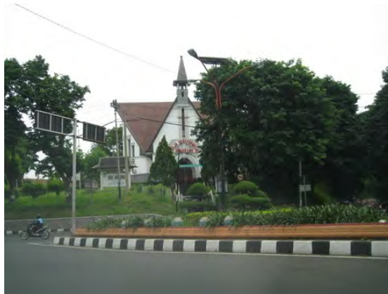
Semarang, Gereja Geref. Kalisari (foto 2008)