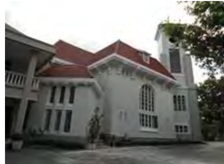
Surabaya, GPIB Imanuel