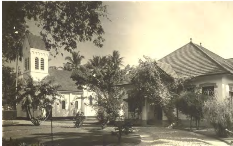
Medan, Gereformeerde Kerk en pastorie (foto 2007)