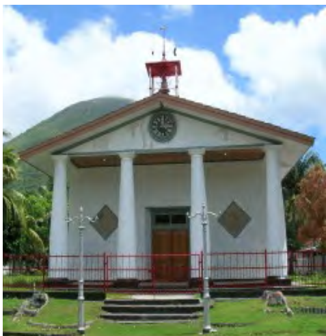
Bandaneira, gerestaureerde kerk, foto 2008.