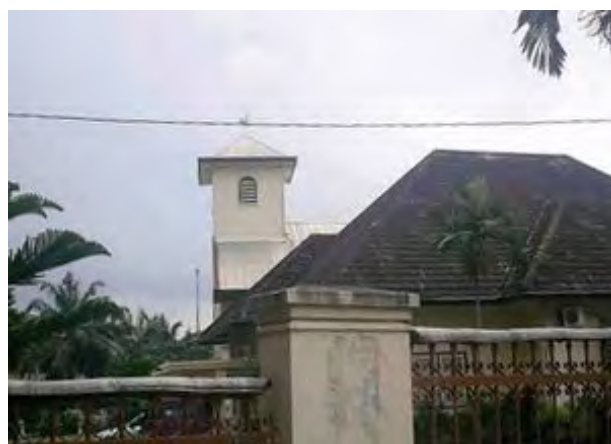
Palembang, GPIB Immanuel, gebouwd ca. 1920, foto 2008.