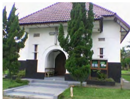
Pematang Siantar, GPIB Maranatha, foto 2009.