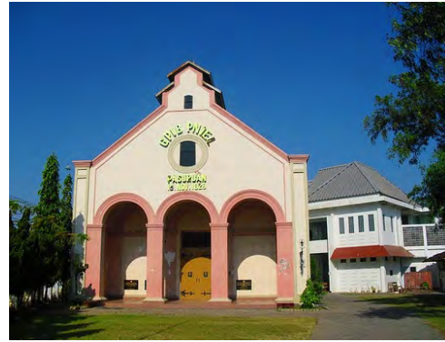
Pasuruan, GPIB Immanuel