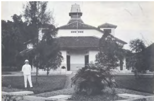
Yogyakarta, Gereformeerde Kerk, jaren 1930