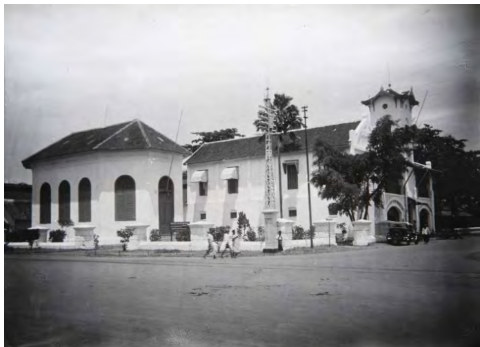
Cheribon (Cirebon), rechts de Indische Kerk, ca 1930