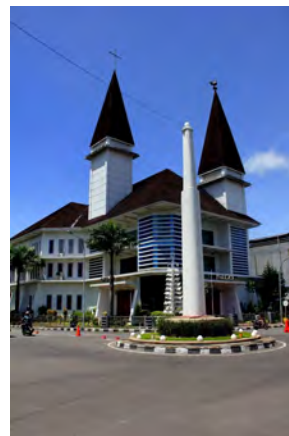
Ambon-stad, GPM Silo