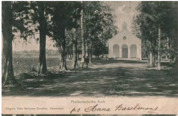
Pasuruan, Indische Kerk, voor de oorlog