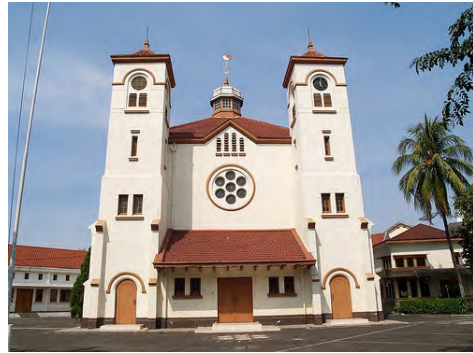
Jakarta; GPIB Pniël, ca 2000