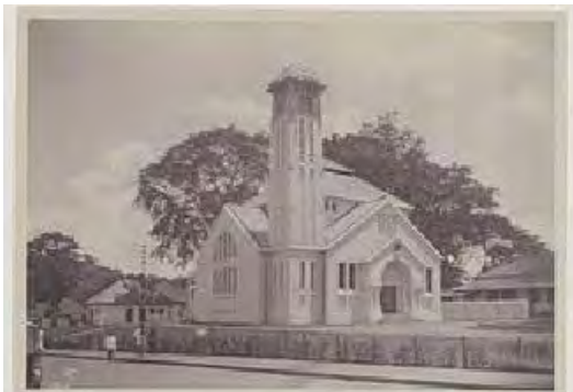
Bandung, Indische Kerk gebouwd 1925, foto ca 1925, Collectie KITLV.