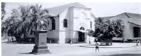
Yogyakarta, Indische Kerk Marga Mulya, voor de oorlog