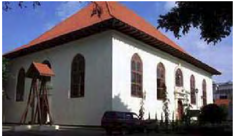
Jakarta, P. Buitenkerk (foto 2004)