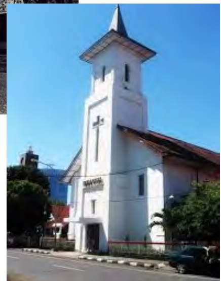
Makassar, GPIB Immanuel