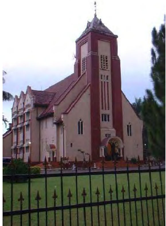
Bogor (Buitenzorg), GPIB Zebaoth (foto 2004)