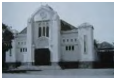
Jakarta, Gereja Kristen Indonesia Kwitang, na de verbouwing