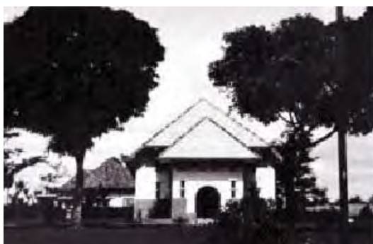
Pematang Siantar, Indische Kerk, foto 1935, Collectie KITLV