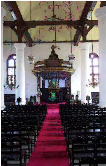
Jakarta, P. Buitenkerk, interieur (foto 2004)