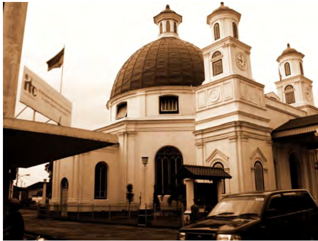
Semarang, GPIB-Immanuel , Koepelkerk ( Gereja Blenduk), gebouwd 1753, foto 2007.