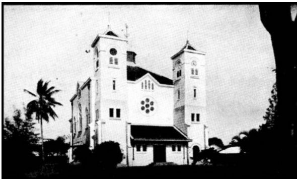
Jakarta, Indische Kerk, Nieuwe Kerk, voor de oorlog